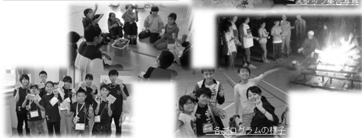
各プログラムの様子