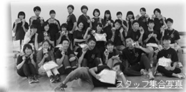
スタッフ集合写真