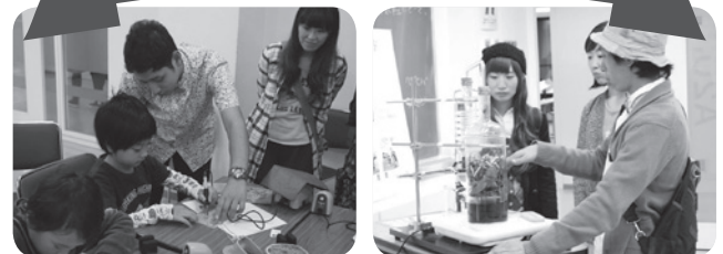
ウッドバーニング