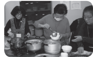
お汁粉・お雑煮を 午前中から準備