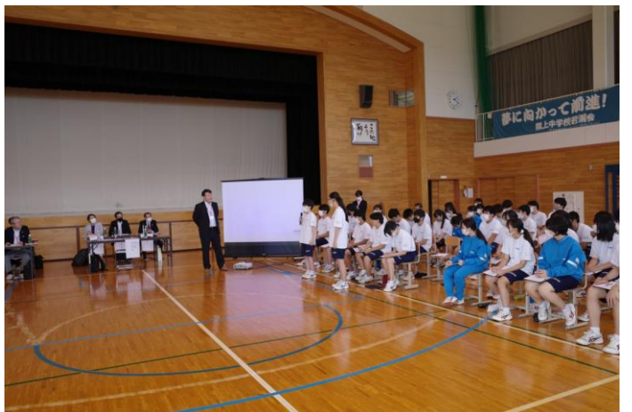
参加者と中学生の質疑応答、ディスカッションの様子