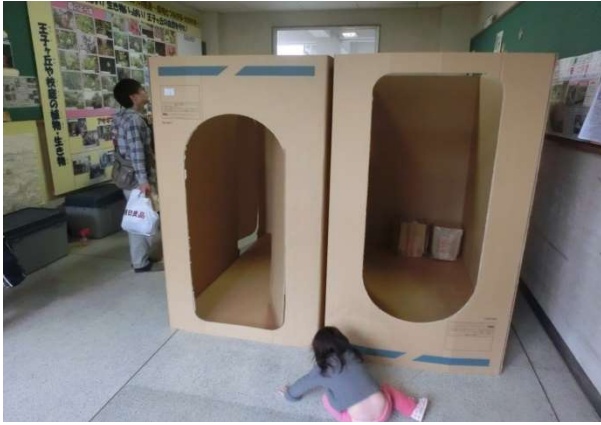
組み立てたBOXパーティション組立