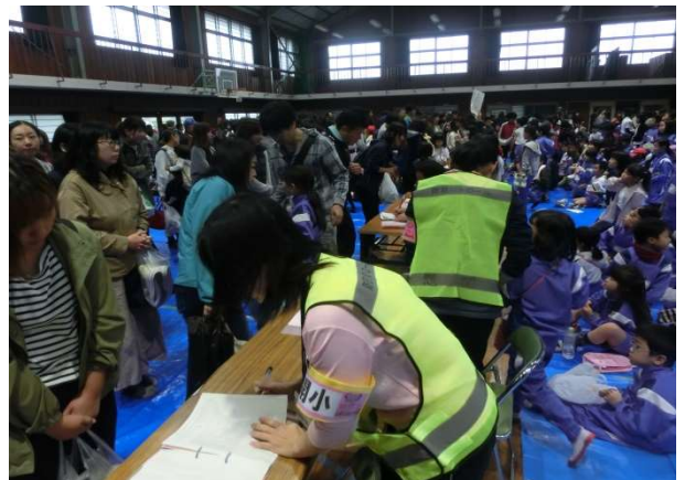
児童引渡し訓練の様子