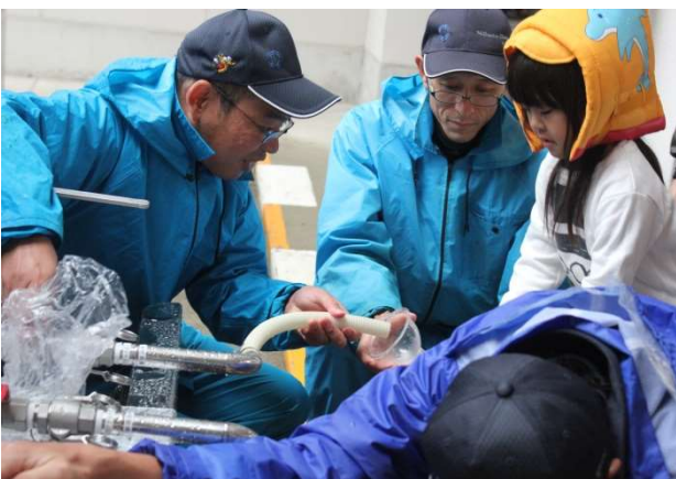
給水車から水を汲む体験