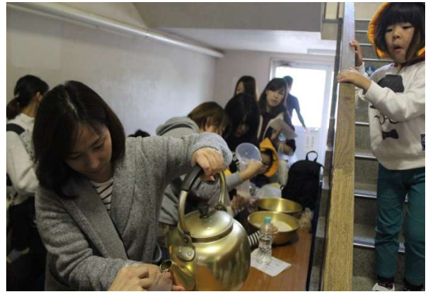
日本赤十字社によるハイゼックスを使った炊飯