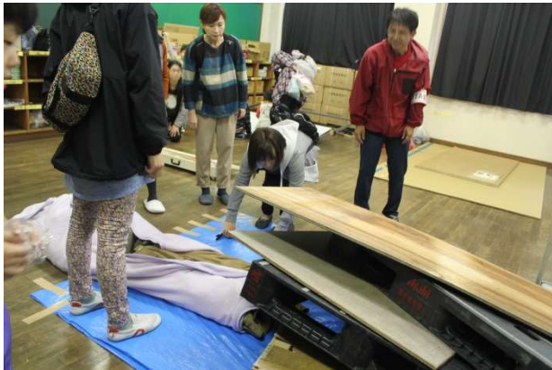
けが人救助班でけが人役の人形を救出