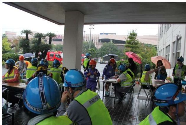
教員による児童の避難者受付