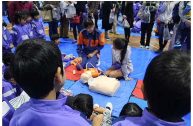
AEDを使った心肺蘇生法を学ぶ