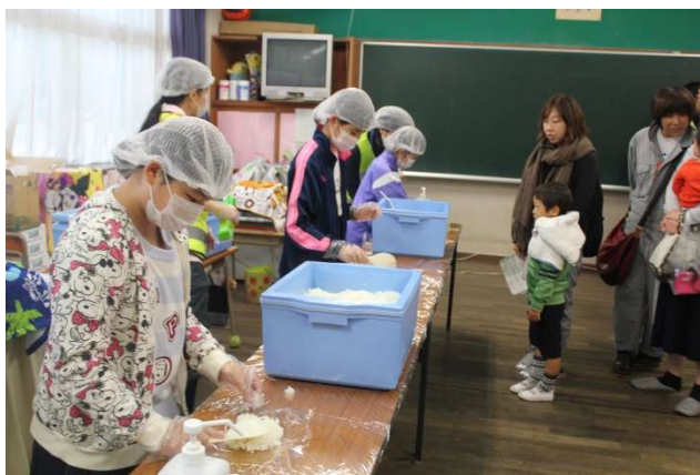
炊き出し班でおにぎりを配る