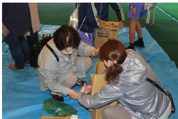
段ボール簡易トイレの組立を学ぶ保護者