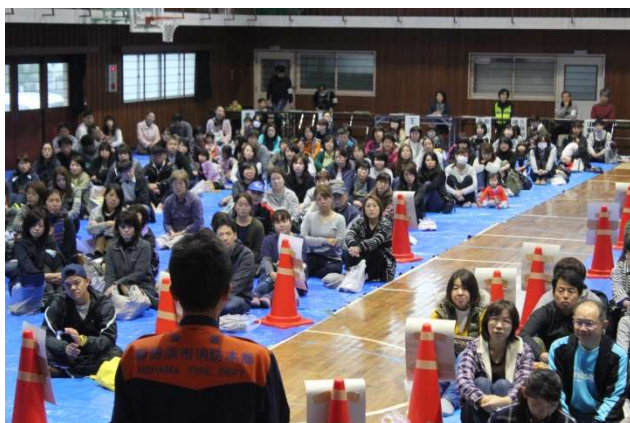
地区ごとに区割りし避難した体育館内（開会式）