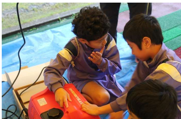
非常電源班でのやり方を学ぶ児童