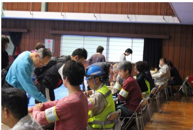
各自治会ごとに地域住民の避難者受付