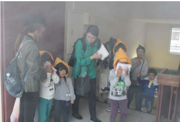
煙体験で鼻と口を押える幼稚園児たち