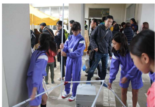
簡易パーティションを組み立てる児童