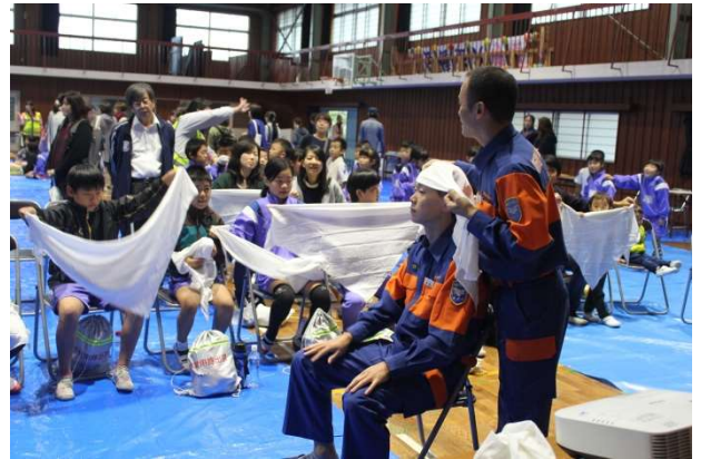
三角巾を使った応急処置法を学ぶ