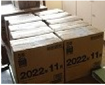
↑助成金により、備蓄品の購入