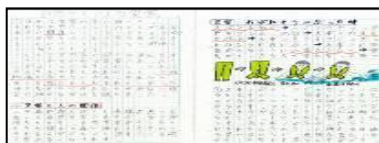
自然や人による災害