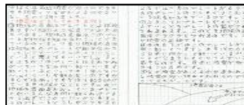
どうして地震はあつて？