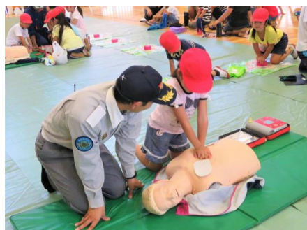
地区合同防災訓練