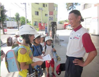
防災マップづくりのための現地調査