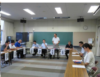
学校防災連絡会議