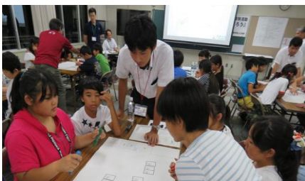
宿泊型避難所体験学習 避難所運営（HUG）ゲーム