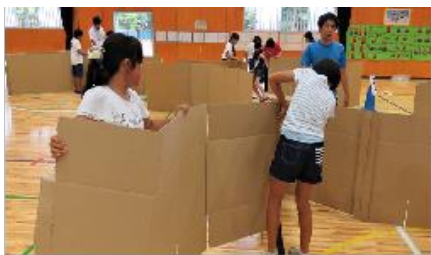
宿泊型避難所体験学習 段ボールハウスづくり