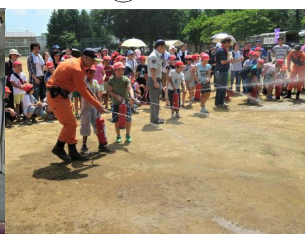
地区合同防災訓練