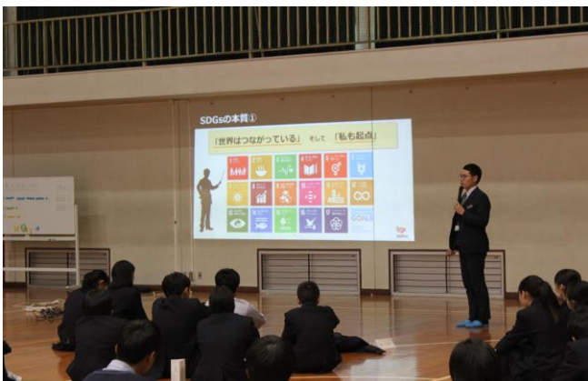
図2 SDGs ワークショップ

SDGs ワークショップでは経済・環境・社会すべての分野が連鎖しているということ、カードゲームを通して学んだ。最初は経済活動を重視して自分のグループがお金を貯めることだけを目標にしていたが、徐々に全体の活動を見通して社会に還元できるカードの使い方をグループ同士で話し合いカードを交換できるようになった。(図2, 図3) 3学期の生徒の個人レポートでは、水害からの避難についてのレポートを一例にあげると、自らマンホールや側溝の場所を調べ、マップを作り、効果的な発信方法や地域との連携を求める提言をしている。防災・減災の観点から活動を通して課題を解決し発見する力を身に付けている。(図4)