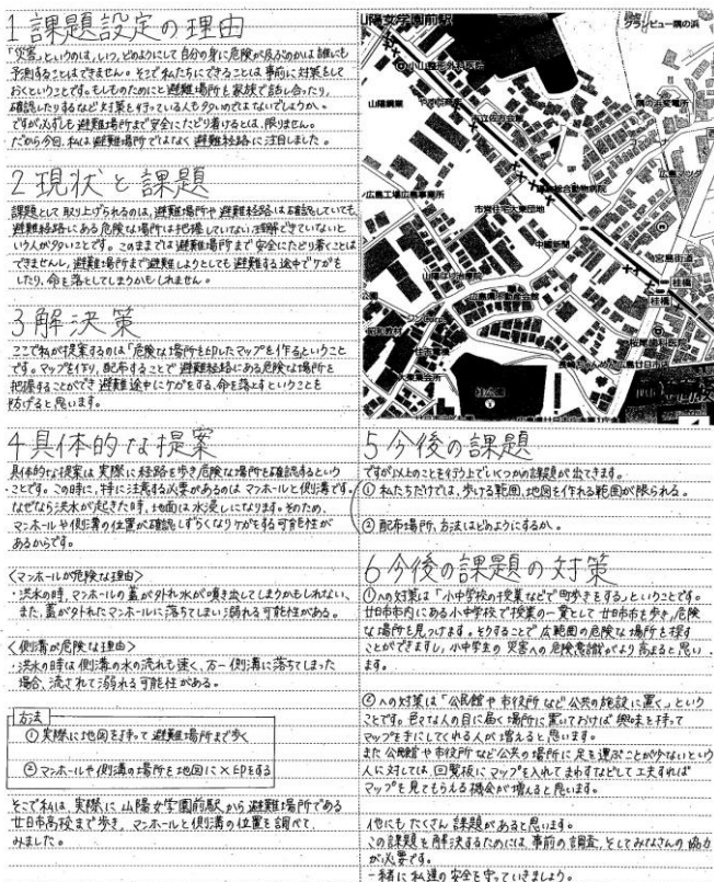
図4 生徒の個人レポート