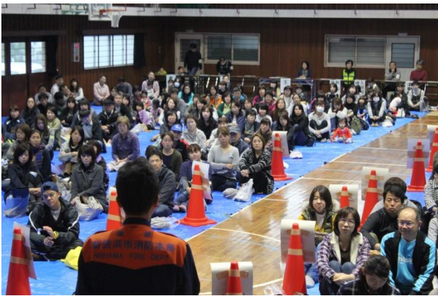
地区ごとに区割りし避難した体育館内（開会式）