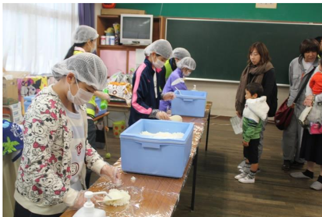
炊き出し班でおにぎりを配る