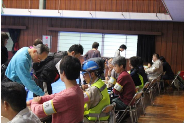
各自治会ごとに地域住民の避難者受付