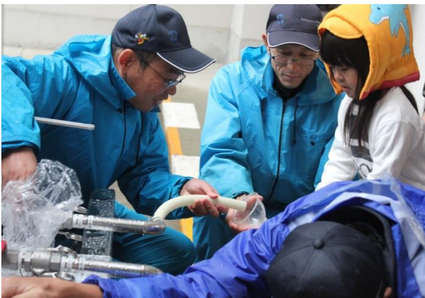
給水車から水を汲む体験