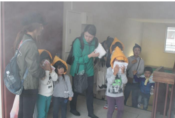
煙体験で鼻と口を押える幼稚園児たち