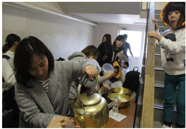
日本赤十字社によるハイゼックスを使った炊飯