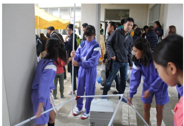
簡易パーティションを組み立てる児童