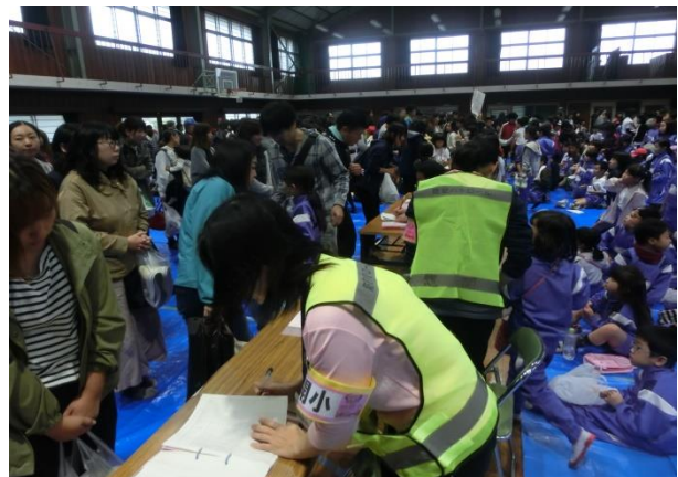
児童引渡し訓練の様子