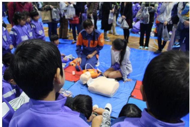
AEDを使った心肺蘇生法を学ぶ