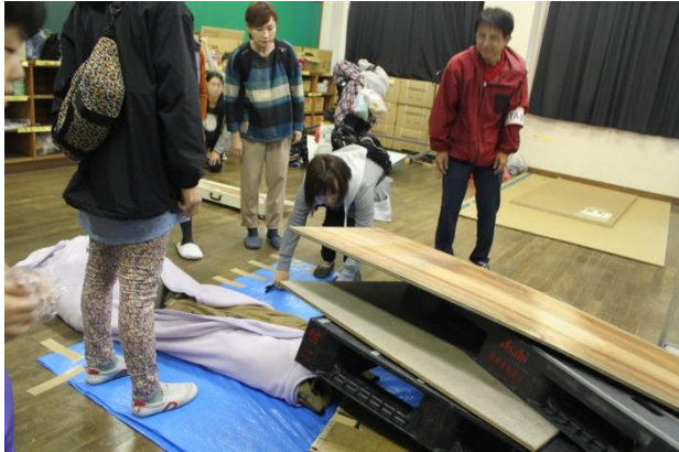
けが人救助班でけが人役の人形を救出