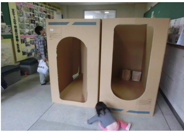
組み立てたBOXパーティション組立