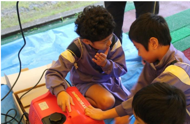
非常電源班でのやり方を学ぶ児童