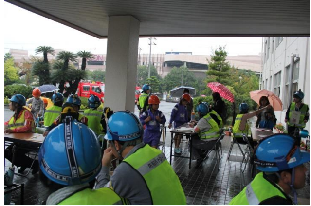
教員による児童の避難者受付