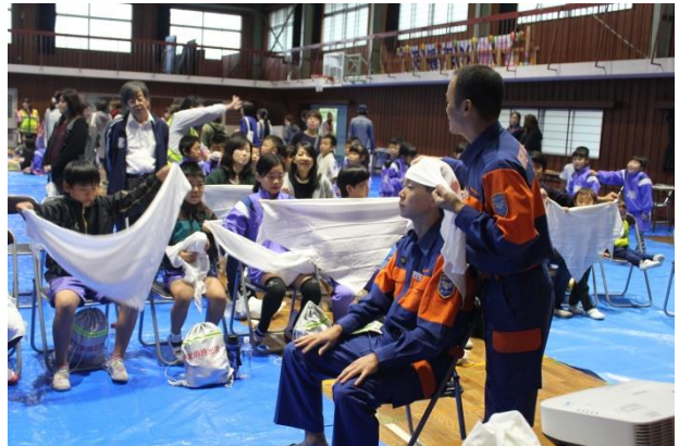
三角巾を使った応急処置法を学ぶ