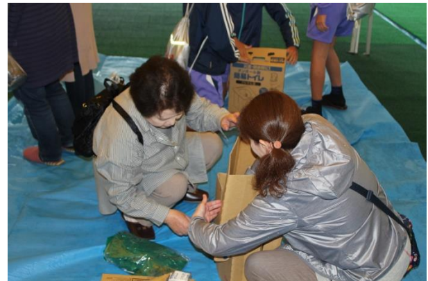
段ボール簡易トイレの組立を学ぶ保護者