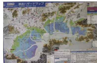
[岡山市ハザードマップ]