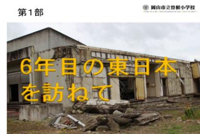
[校長授業プレゼン]