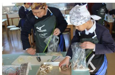
[袋詰め (空気を抜く)]