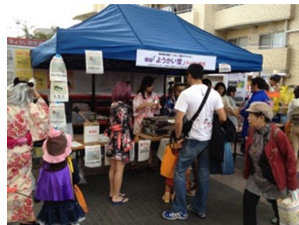
地域商店街での現在イベント&東北報告