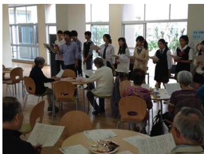
高齢者との唱歌による交流

自治会や行政が主導になって運営される組織とは異なり、高校生が孫の世代にあたる高齢者、おにいさんおねえさんにあたる小学生、留学生と年齢の近い外国人留学生などの関係は和やかなコミュニケーションを形成し、組織運営に良い影響を与えた。このようなコミュニケーションが小学生、高齢者、外国人という横の関係にもつながり、目標達成の原動力にもつながっていった。