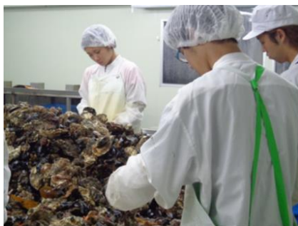
宮城県石巻市にてカキの出荷作業体験