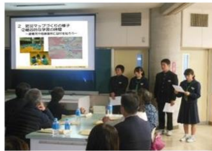
民生委員さん方へ取組 を発表

ともに、防災マップを通して学んだ地域特性を踏まえ、災害時の対応について地域住民と共有し、避難訓練への参加も積極的に呼びかけた。