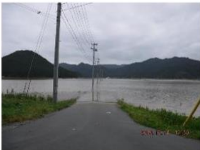
台風第19号大川地区の冠水 地域によっては1m以上の床上浸水の場所もあった