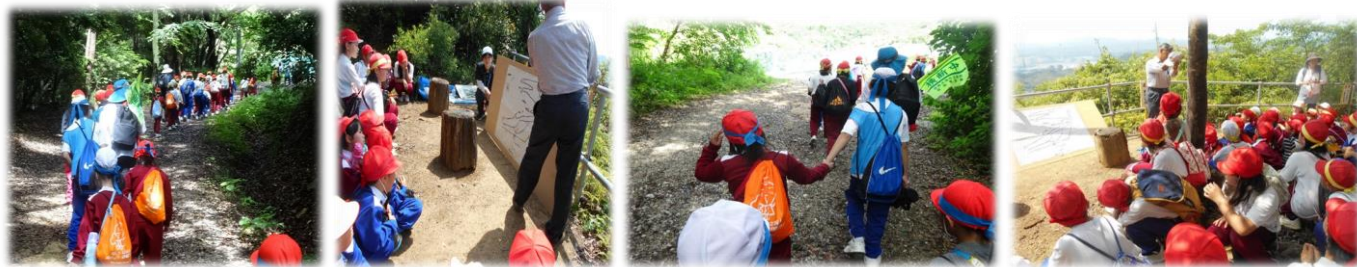
11月実施の津乃峰町避難所巡りウォークラリー