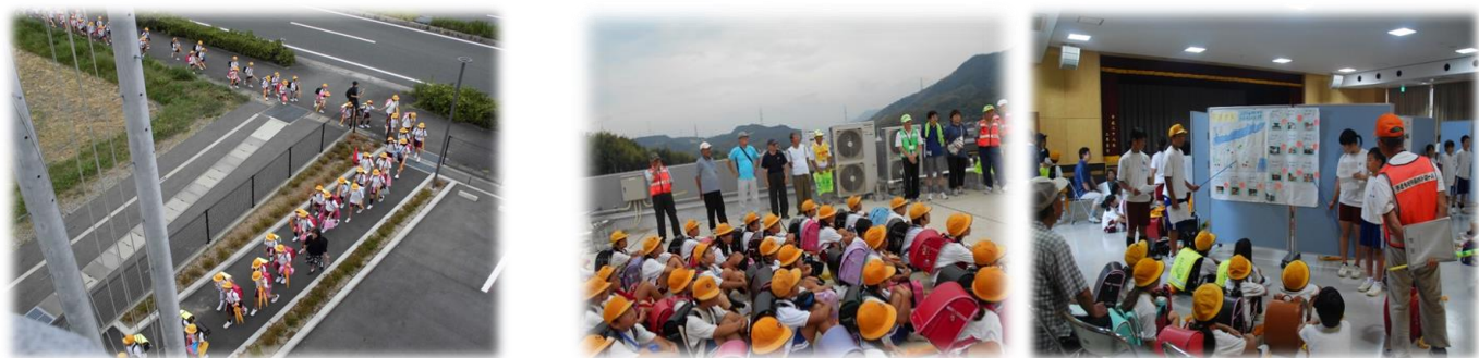
避難所巡りウォークラリー（今年は、海沿いの地域を・・・）