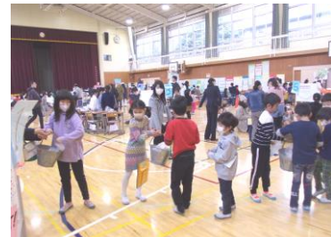
「地域防災会議」バケツリレーの様子