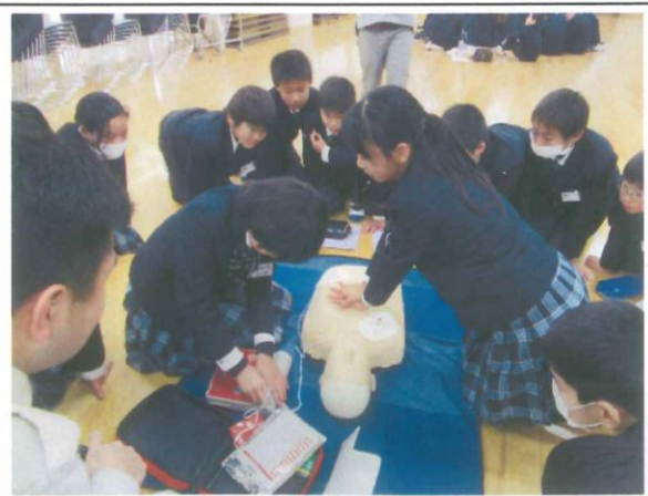
5年生 心肺蘇生実習 ～救命救急講習会～