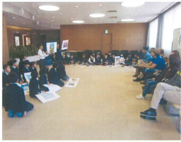
3・4年生 西南学院大学留学生との国際交流 ～自分たちの減災学習の発信と外国の減災事情～