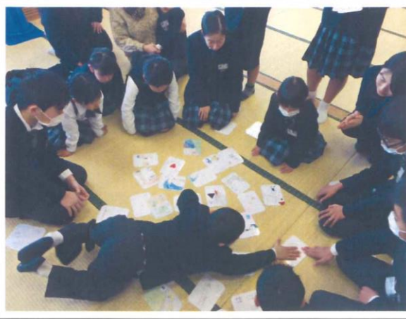
2・7年生 減災カルタ大会 ～7年生が作成した減災カルタを使って～