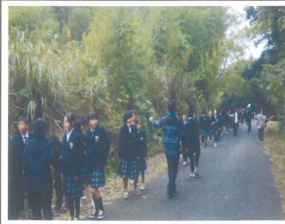
裏山への津波災害避難訓練 ～玄海みらい学園児童生徒と高等学校と合同で～