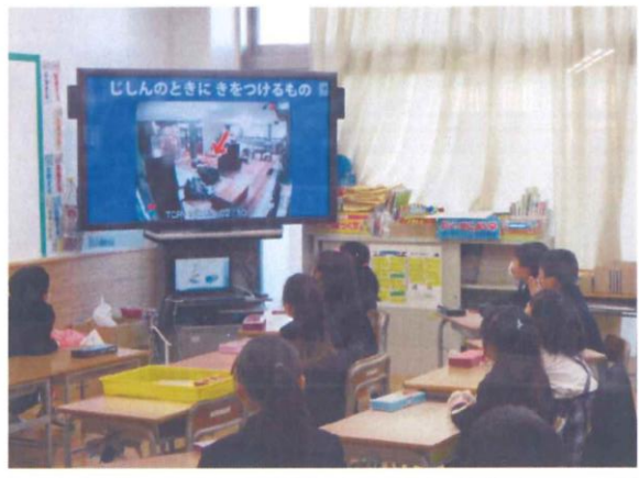
1年生「じしんってなに？」授業