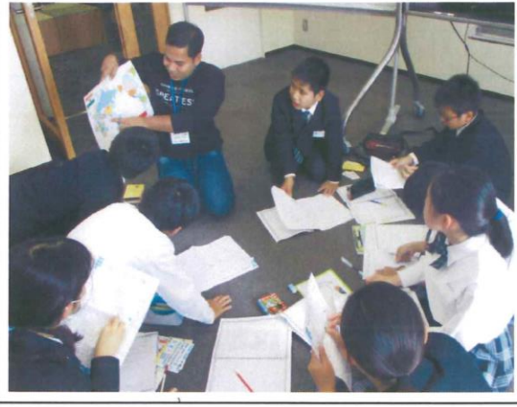
5・6年生 九州産業大学留学生との国際交流 ～自分たちの減災学習の発信と外国の減災事情～