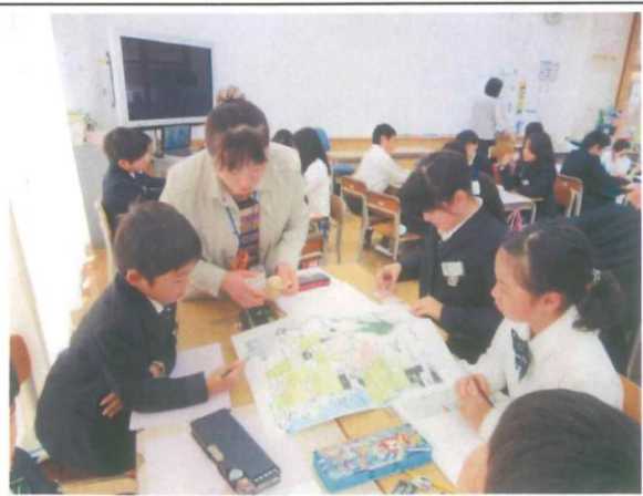
5年生 防災マップ作成 ～民生委員さんの協力の下～