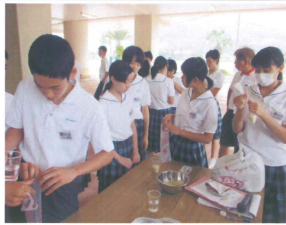
8年生 非常食の準備 ～赤十字講習の中で～