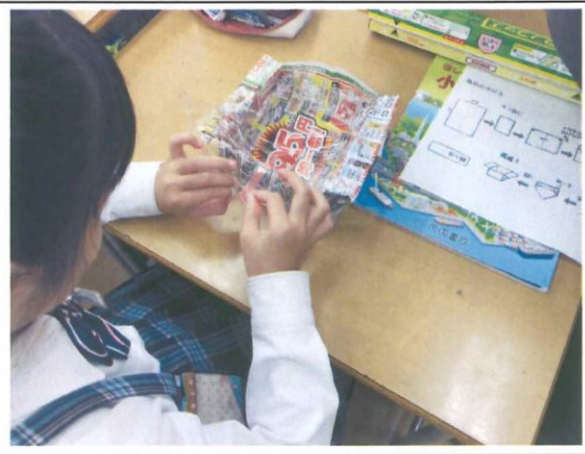
4年生 もし、災害が起きたとき… 「ラップを使った紙皿づくり」