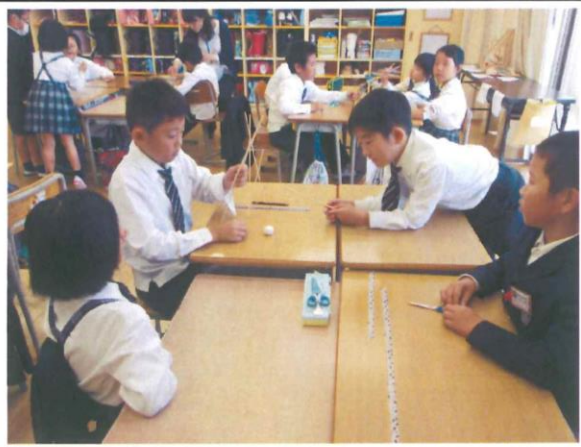
3・4年生コミュニケーションスキル 「竹ひごタワーを作ろう」