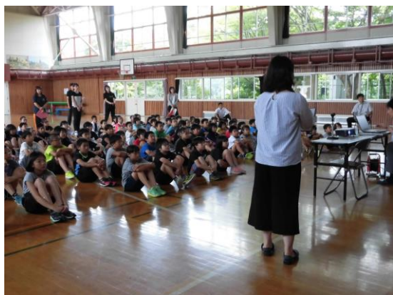
難訓練後の防災講話 1