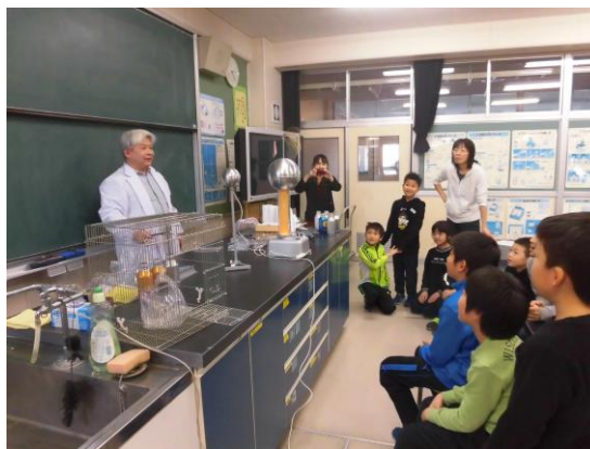
長南氏（弘前大学）による授業 2