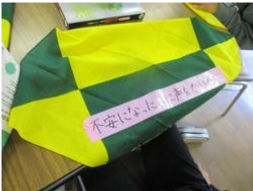
避難所キッズスタッフのバンダナ