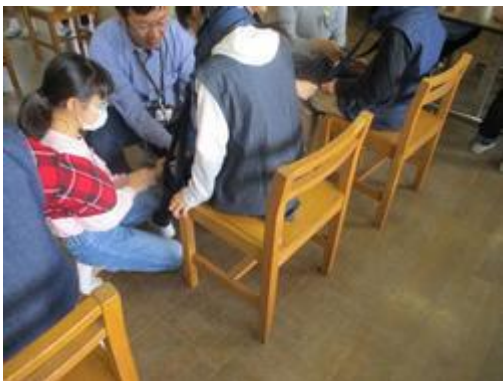
高齢者疑似体験～関節が動きにくくなるギブスを装着して身体の動きにくさを体験