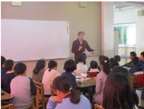
地区自主防災・防犯協議会の方が講師