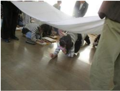
地震後の火災による煙から身を守る