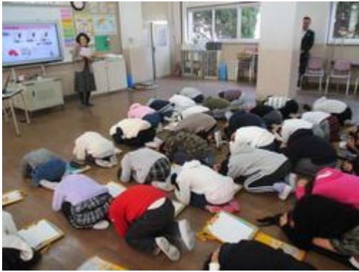
ダンゴムシのポーズ