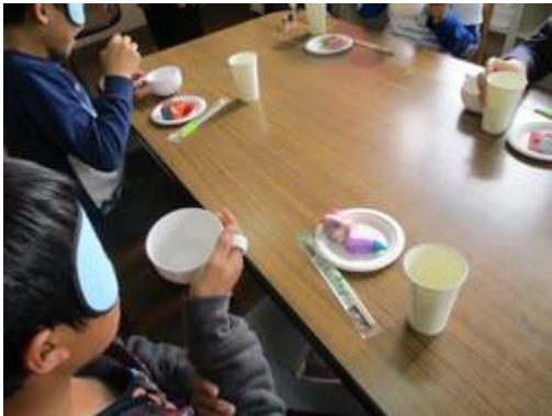
アイマスク体験～食事を摂る疑似体験