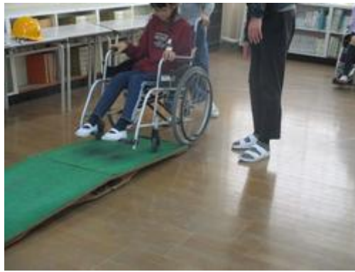
車いす体験～踏切版を坂道と想定