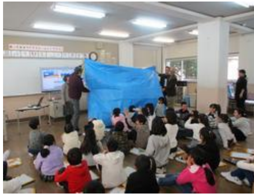
ブルーシートを津波に見立ててイメージする