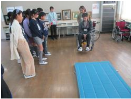
車いす体験～マットをめぐるみと想定