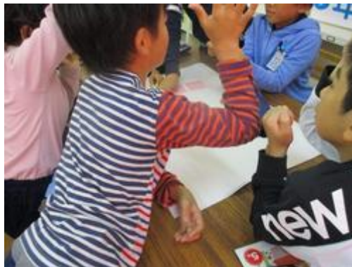
クロスロードゲームでの話し合い