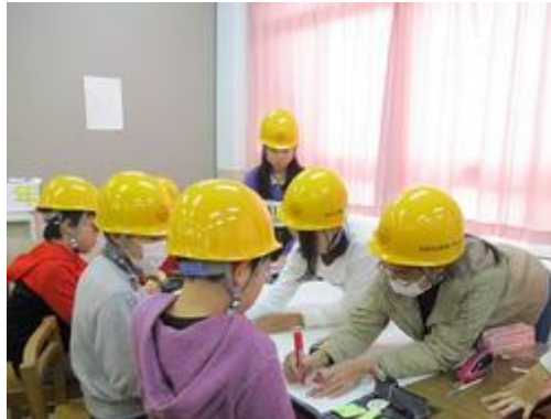
助成金で購入した防災ヘルメットをかぶり、クロスロードゲームを行う。