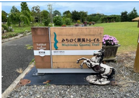
潮風トレイル発着地点