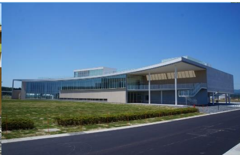
東日本大震災・原子力災害伝承館