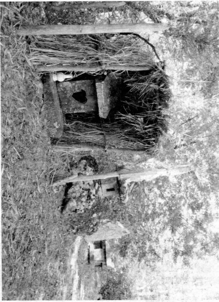
狼を守護神とし、勧請した「三峰権現」 二坂室三峰社

江戸時代、猪垣 ぶら だけは獣害を 防げず、困り果てた現在の茅野市 金沢、富士見町にあった10カ村の 村人たちは、藩から鉄砲を借用し、 鉄砲打ちを雇った。給金は各村が分 担して支払い、首尾よく猪を射止め た場合は給金の他に1匹につき2 0文の褒美を支払うと定めた。 こうして様々な対策を講じた が、十分に防げず獣害除けに御利 益があると思われる神使の「山火 様」や狼を守護神とする「三峰権 現」を勧請した。 しかし、皮肉なことにその狼が 多数出て村人も襲われてしまっ た。寛政11(1799)年のある 朝、乙事村で事件が起きた。草刈 たそだ。