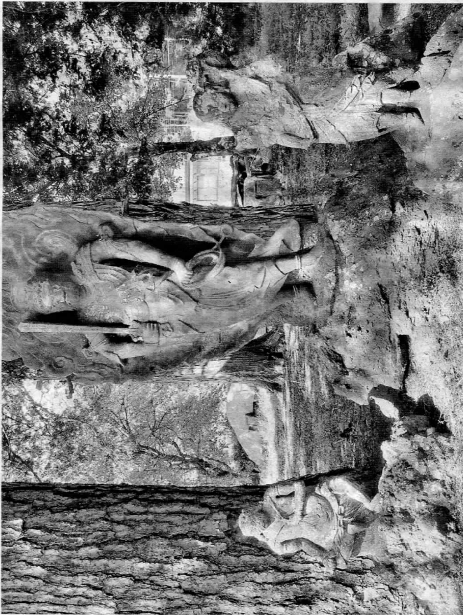
権現の森の参道にある不動明王立像とゴンガラ童子立像、セイヤカ童子坐像