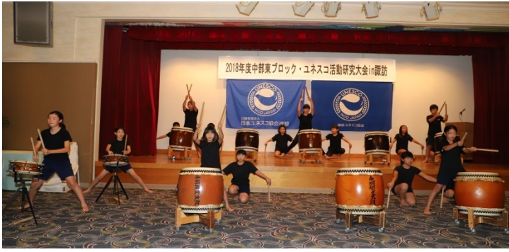
オープニングで熱演した縄文太鼓演奏

昨年よりユネスコスクールとして活動している永明小学校の縄文太鼓クラブ員による演奏は聞く者の心をとらえ、オープニングにふさわしいものとなった。来賓として来られた中島恵理長野県副知事も熱心に耳を傾けておられた。