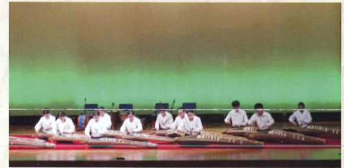
県立橋本高校邦楽部