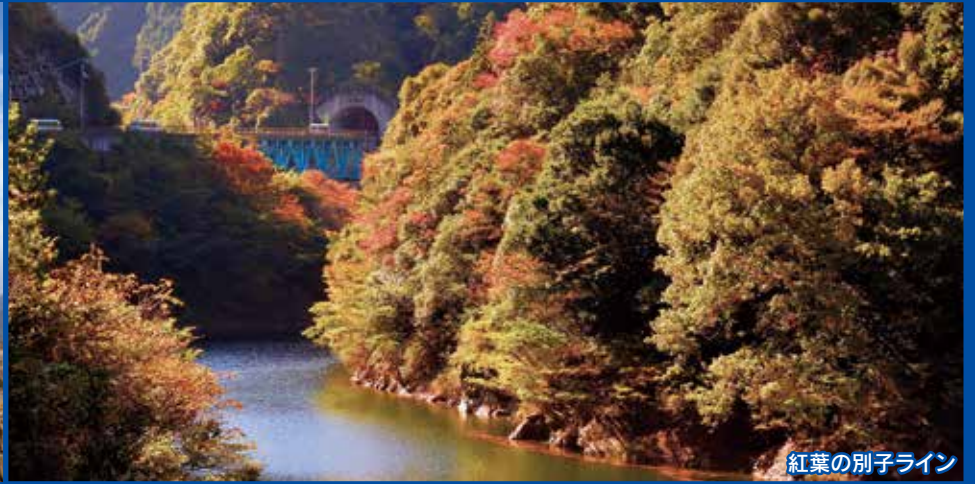
紅葉の別子ライン