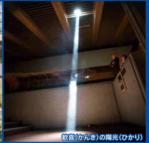
歓喜(かんぎ)の陽光(ひかり)