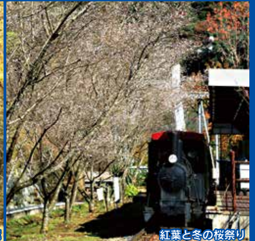
紅葉と冬の桜祭り