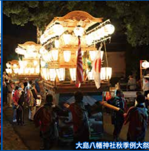
大島八幡神社秋季例大祭