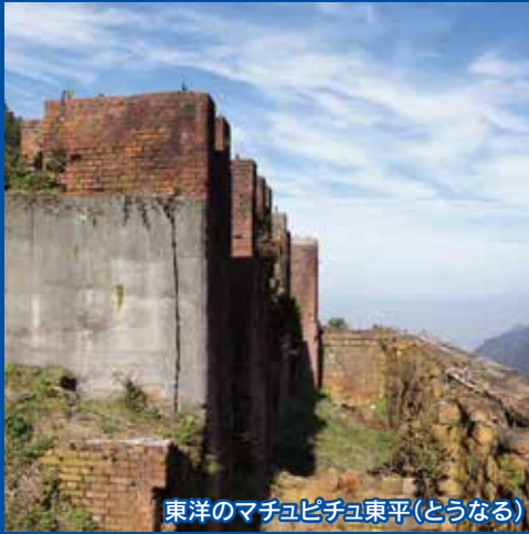
東洋のマチュピチュ東平(とうなる)