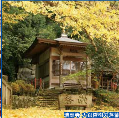
瑞應寺 大銀杏樹の落葉