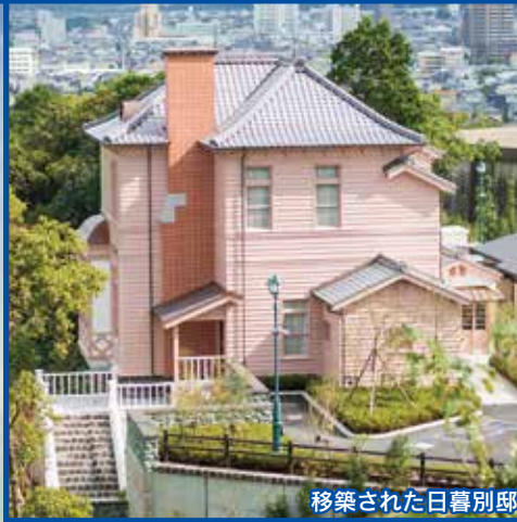
移築された日暮別邸